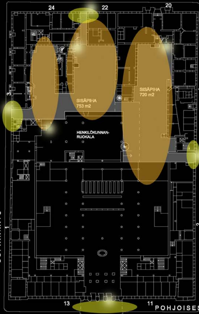
SISÄPIIHA 1473 M 2